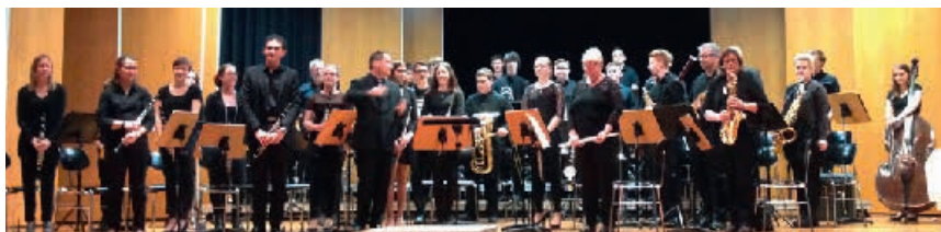
Le « Blatorchester de Mössingen » sur scène

Le canton de Saint-Julien qui englobe 17 communes est jumelé depuis plus de 26 ans avec la ville allemande de Mössingen, dans le Land de Bade-Wurtemberg, non loin de la ville universitaire de Tübingen.