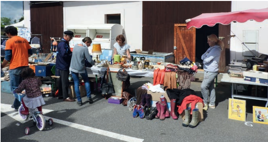
Le stand du CCAS

Ce samedi 20 mai par une météo relativement clémente, le Sou des écoles d'Archamps, organisait son maintenant annuel vide-grenier sur le parking de la Mairie. Ce rendez-vous est très prisé des amateurs de bonnes affaires et des participants peuvent venir de loin pour en profiter.